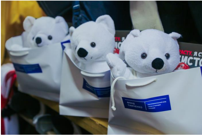
Готовые пакеты с призами для победителей