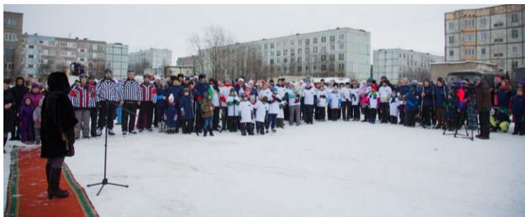
Церемония открытия турнира

По ходу церемонии открытия, которая длится около 10 минут, приветственные речи произносят VIP-гости турнира, ведущий объявляет о начале праздника. Эту часть фестиваля можно при необходимости исключить.