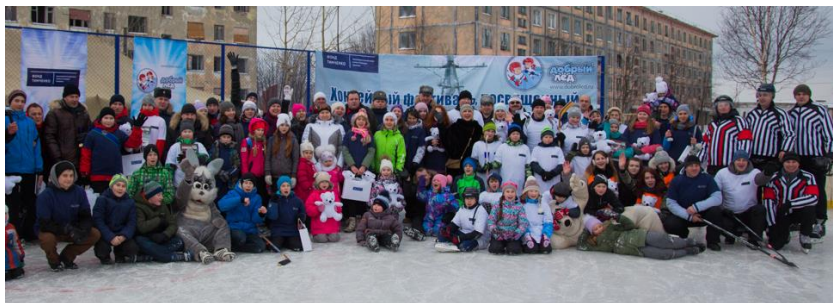
Участники однодневного хоккейного фестиваля в пос. Сафоново, Мурманская область, 22 февраля 2016 г.

Начиная с 2013 года, Благотворительный фонд Елены и Геннадия Тимченко проводит однодневные хоккейные фестивали для дворовых команд. На последней серии таких турниров в Мурманской области (20-23 февраля 2016 года) за 3 дня в соревнованиях приняли участие более 500 участников, мероприятия собрали больше 2000 зрителей.