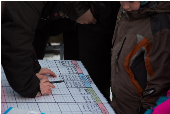
Составление расписания турнира

По ходу церемонии открытия, которая длится около 10 минут, приветственные речи произносят VIP-гости турнира, ведущий объявляет о начале праздника. Эту часть фестиваля можно при необходимости исключить.