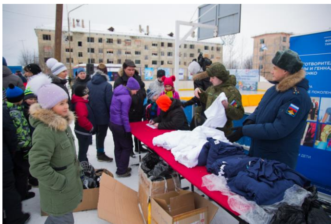
Процедура регистрации происходит за отдельным столом

Во время подготовительной части, которая занимает приблизительно 40-50 минут, происходит подготовка к открытию, главный судья регистрирует участников, начинают свою работу интерактивные зоны, аттракционы и т. п. Организаторы определяют примерное количество участников турнира. Пример заполнения таблицы участников турнира см. в приложении 1 .